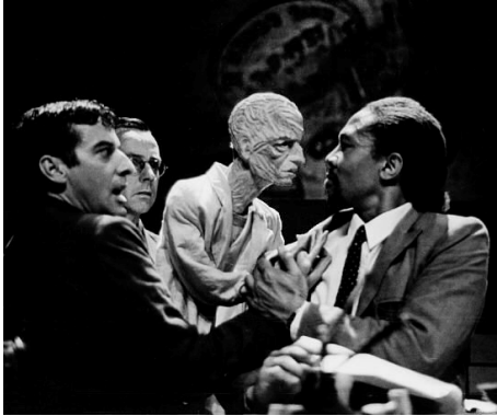
Fig. 2.1: Faustus in Africa (1994). Marionnette de Faust, réali- sation: A. Kohler.

ces restes renvoient aux victimes de l'apartheid. Le gestus social 5 a ainsi été posé; ses effets devraient amener le spectateur à cette action critique dont rêvait Brecht.