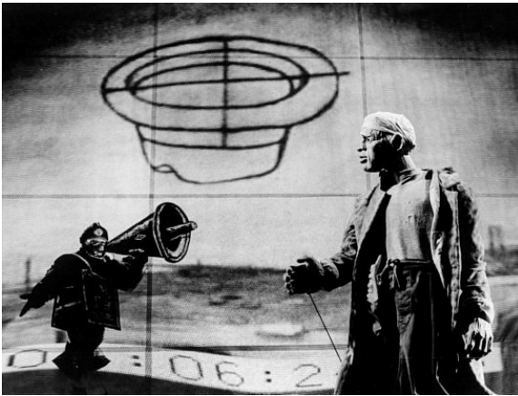
Fig. 1.3: Woyzeck on the Highveld (1992). Animation: William Kentridge.

– à chaque fois que le docteur se penche pour ausculter Woyzeck, apparaît en projection une «oreille». Lorsque le docteur approche le stéthoscope de son oreille à lui, comme pour analyser ou comparer en quelque sorte la «captation» de l'univers intérieur de Woyzeck, apparaît en projection un «mégaphone». Pragmatiquement, la fonction de l'oreille est celle de patient qui convoque le thème de l' obéissance . Le mégaphone, par son pouvoir de diffuser et, surtout, d'augmenter les sonorités, est représentatif de la fonction d' agent . Dans le contexte de la pièce, le mégaphone apparaît plusieurs fois (pour un exemple, voir Figure 1.3 ), pour symboliser donc un agent de répression, puisque c'est souvent un instrument d'oppression, ou encore de manipulation: il menace ou domine les foules par le pouvoir du son augmenté.