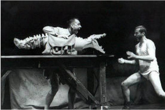
Fig. 3.2: Ubu and the Truth Commission (1998).

L'autre marionnette (voir Figure 3.2 ), le crocodile , représente un animal d'Afrique et, en même temps, l'animal politique féroce de la société sud-africaine, un «mangeur» de preuves. C'est parce que bien des preuves ont été «effacées» que l'on a opté pour cette forme rare de récupération de la vérité, donc de la mémoire du passé, qu'est la Truth and Reconciliation Commission . L'image du crocodile qui avale les preuves incriminantes est ainsi très suggestive de faits réels qui ont marqué l'histoire récente de l'Afrique du Sud.