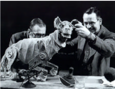
Fig. 2.2: Faustus in Africa (1994). Marionnette du chien, réalisation: A. Kohler.

Pour ce qui est de Faust, bien qu'il soit difficile de dire qui il représente exactement, il semble incarner ce colonisateur qui aurait vendu son «âme» et qui, à travers cette cruelle aventure coloniale, écrase la notion même d'«humanité». Une idée intéressante pour la figure de Faust, en rapport avec ce qui vient d'être dit sur son apparence scénique et la constitution physique de la marionnette, pourrait être celle que le «Diable n'est pas noir, mais blanc». L'image se constituerait donc en un discours politique accusateur d'autant plus puissant que ce sont les moyens scéniques qui le réalisent.