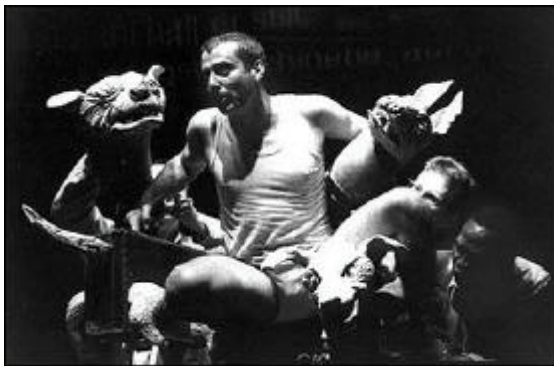
Fig. 3.1: Ubu and the Truth Commission (1998).

The character of the three-headed dog – three different characters reluctantly sharing one fate – became part of the heart of the material of the play. What started its life as a kind of technical concern, or as a limitation [références aux difficultés de manipulation de trois marionnettes séparées, vu le personnel artistique limité], became a character in its own right and carried with it a whole weight of associations. 8